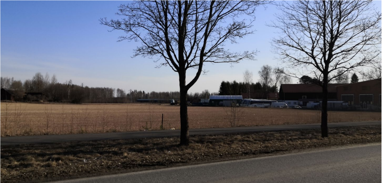
Kuva 4. Näkymä Kiltintieltä tulevan Peltokiltinkadun suuntaan (7.4.2020).

Nykyinen pienipiirteinen katu, uudelta nimeltään Peltokiltinkatu (kuvat 1. ja 3.) palvelee riittävän hyvin suunniteltua tontin käyttötarkoitusta. Kaupungin kaavilujen mukaan Pikku-Parolantie 5b -kaavaehdotuksen mukainen Peltokiltinkatu tulee jatkumaan Pikku-Parolantien ja Kiltintien välillä läpiajettavana kokoojakatumaaisena katuna (kuva 4.).