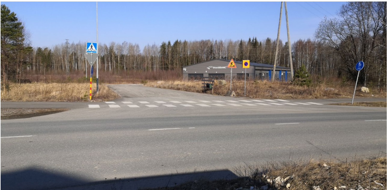
Kuva 1. Peltokiltinkadun nykytilanne (7.4.2020)

Asemakaavan alueella ja sen läheisyydessä ei ole tapahtunut poliisin tietoon tulleita tieliikenneonnettomuuksia vuosina 2015 - 2019.