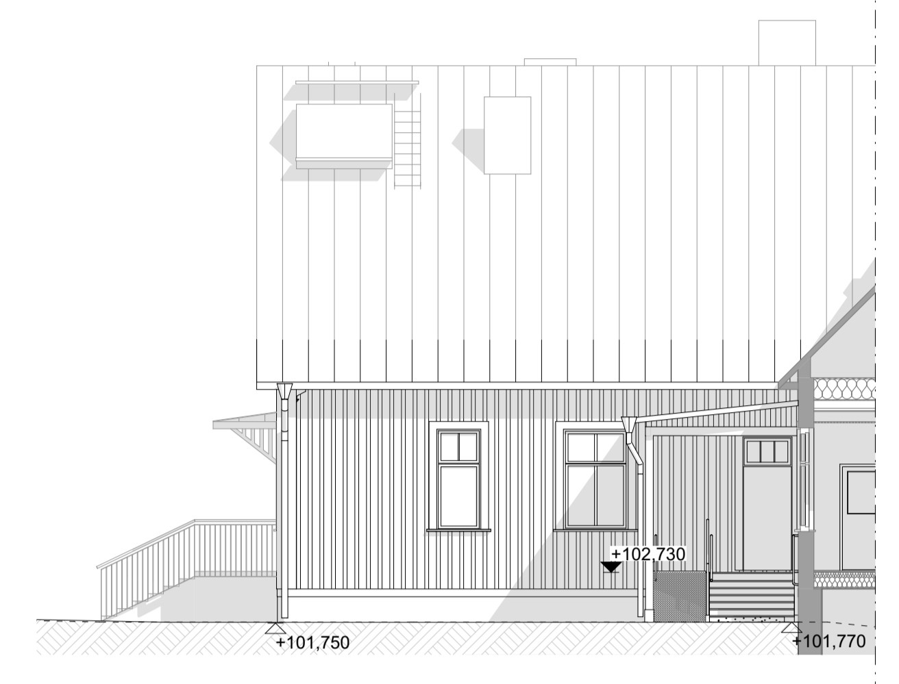
LEIKKAUSJULKISIVU LÄNTEEN uusi sisäänkäyntiporras