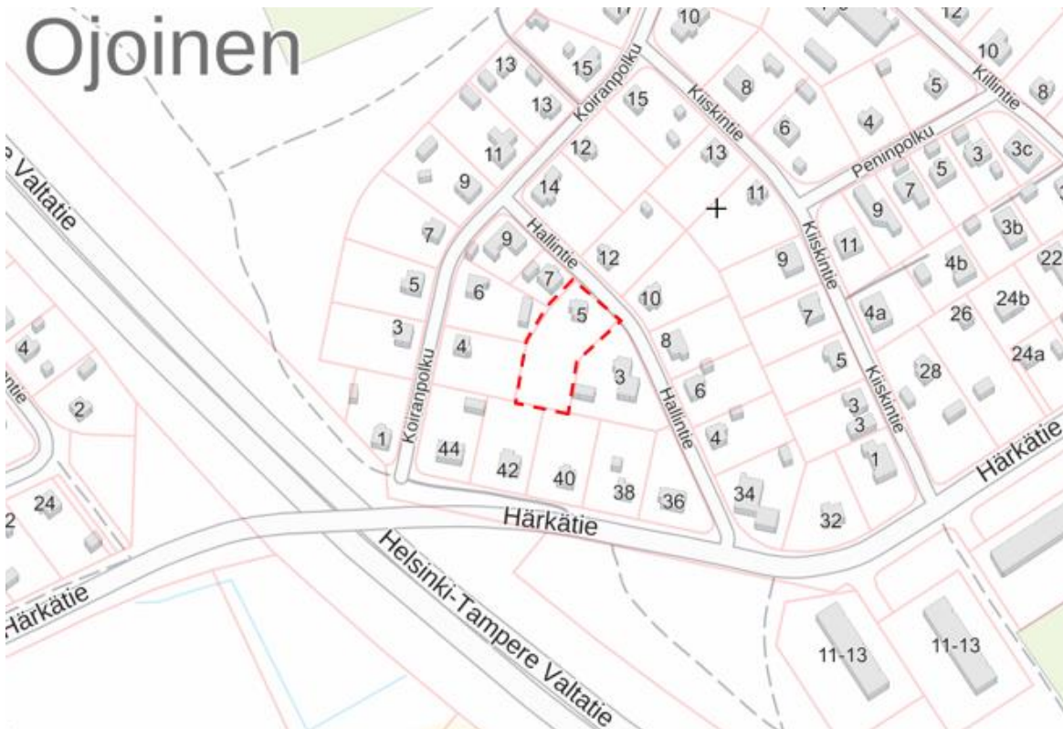
Kuva 1 Tontin sijainti Hallintiellä merkittynä karttakuvaan.

Asemakaavan muutos ja tonttijako koskevat Ojoisten 11. kaupunginosan korttelin 28 tonttia 445 osoitteessa Hallintie 5.