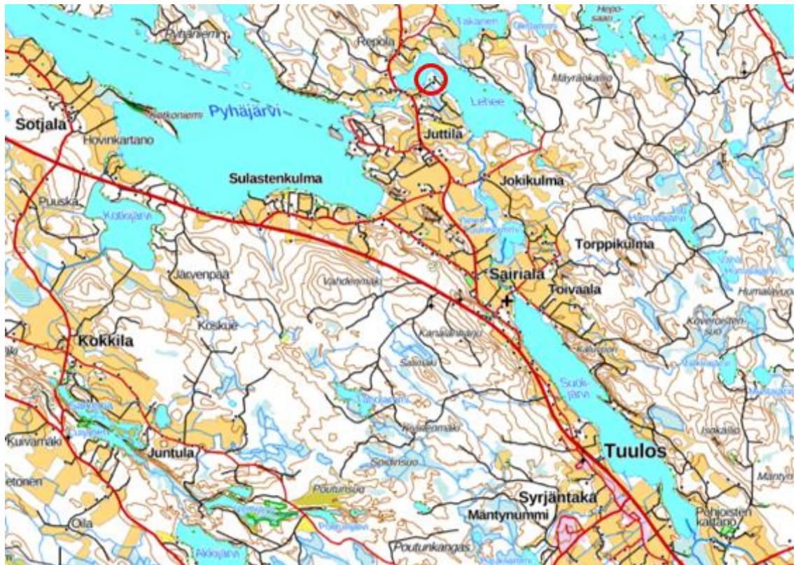
Kuva 1. Suunnittelualueen likimääräinen yleissijainti on esitetty punaisella ympyrällä.

Sekä Niemelän että Niemelänrannan tiloille on rakentunut omakotitalo talousrakennuksineen sekä rantasauna.