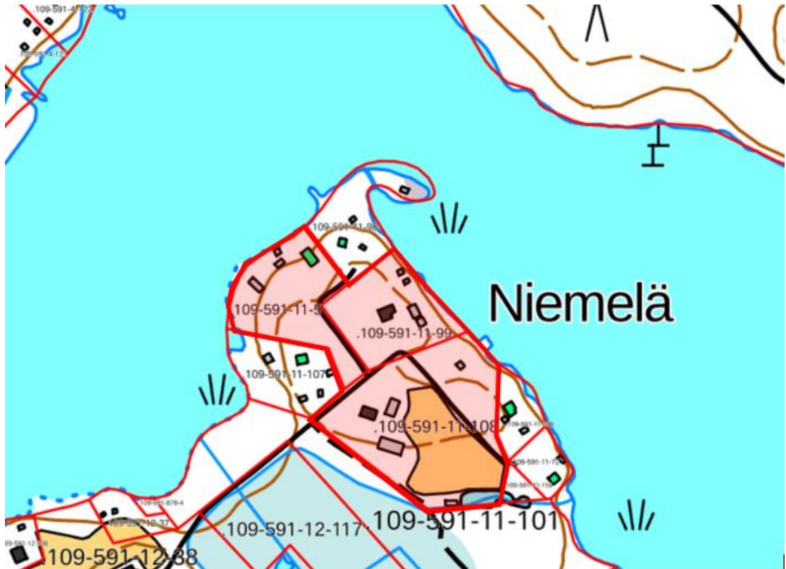
Kuva 2. Suunnittelualueen rajaus.