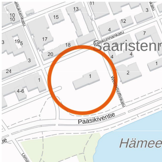
Kuva 1 Suunnittelualueen likimääräinen sijainti kartalla.

Osallistumis- ja arviointisuunnitelma koskee Keskustan kaupunginosassa (numero 4) laadittavaa asemakaavamuutosta. Suunnittelualue