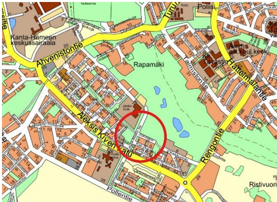
Kuva 1. Kaava-alueen sijainti kartalla

Osallistumis- ja arviointisuunnitelma koskee asemakaavamutosta alueella, joka sijaitsee osittain Voutilan ja osittain Luolajan kaupunginosissa (kaupunginosat 24 ja 25). Alue kattaa kiinteistöt 109-25-9903-15 ja 109-25-9906-4 sekä osan kiinteistöistä 109-25-9901-0 (katualue), 109-416-8-49 (yleinen alue) ja 109-24-9903-14 (Taula-Matin puisto). Alueella ei sijaitse rakennuksia.