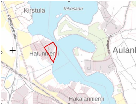
Kuva 1. Kaava-alueen sijainti kartalla

Osallistumis- ja arviointisuunnitelma koskee asemakaavaa ja asemakaavamuutosta Hämeenlinnan keskustan pohjoisosan alueella. Asemakaavan muutos koskee Hämeenlinnan 13. kaupunginosan (Kirstula) kiinteistöjä 109-13-13-4 ja 109-13-9908-4 sekä asemakaava kiinteistöä 109-411-4-45. Suunnittelualueella sijaitsee Ilonpisanan hoivakoti, rantamökki, rantasauna sekä nykyisin varastokäytössä olevat Majaranta- ja Porttila- rakennukset.