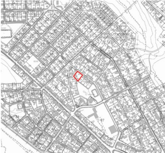
Kuva 1: Kaava-alueen sijainti kartalla

Osallistumis- ja arviointisuunnitelma koskee Hätilän kaupunginosassa (numero 15) laadittavaa asemakaavamuutosta. Suunnittelualue käsittää alustavasti korttelissa 33, tontin numero 303. Tontilla sijaitsee omakotitalo (148 k- m 2 ).