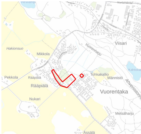
Kuva 1. Kaava-alueiden sijainti kartalla

Osallistumis- ja arviointisuunnitelma koskee Vuorentaan kaupunginosassa (numero 28) laadittavaa asemakaavamuutosta. Suunnittelualue koostuu kahdesta erillisesti alueesta. Vuorentaan koulun suunnittelualue kattaa voimassa olevan asemakaavan nro 2587