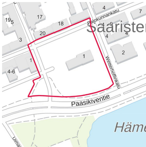
Kuva 1 Suunnittelualueen alustava rajaus kartalla.

Osallistumis- ja arviointisuunnitelma koskee Keskustan kaupunginosassa (numero 4) laadittavaa asemakaavamuutosta. Suunnittelualue käsittää alustavasti linja-autoaseman