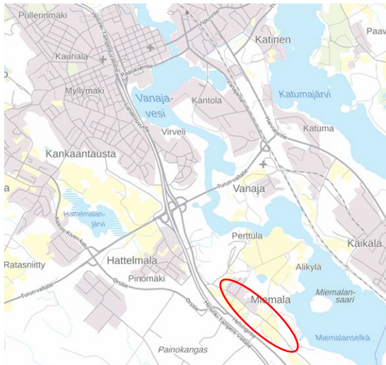
Kuva 1. Kaava-alueen sijainti

Osallistumis- ja arviointisuunnitelma koskee asemakaavaa ja asemakaavan muutosta Miemalassa (kaup.osa 21), suunnittelualue kattaa Riihinummentien ja Miemalantien välisen peltoalueen sekä Miemalantien yhdystien nro 13841 välillä seututie 130 risteys – Palvaanpellon asuinalue. Alueella olevat kiinteistöt, joita suunnittelu koskee ovat: 109-417-18-3, 109-417-8-2, 109-417-4-6, 109-417-4-24 sekä katualuevarauksiin liittyen osat